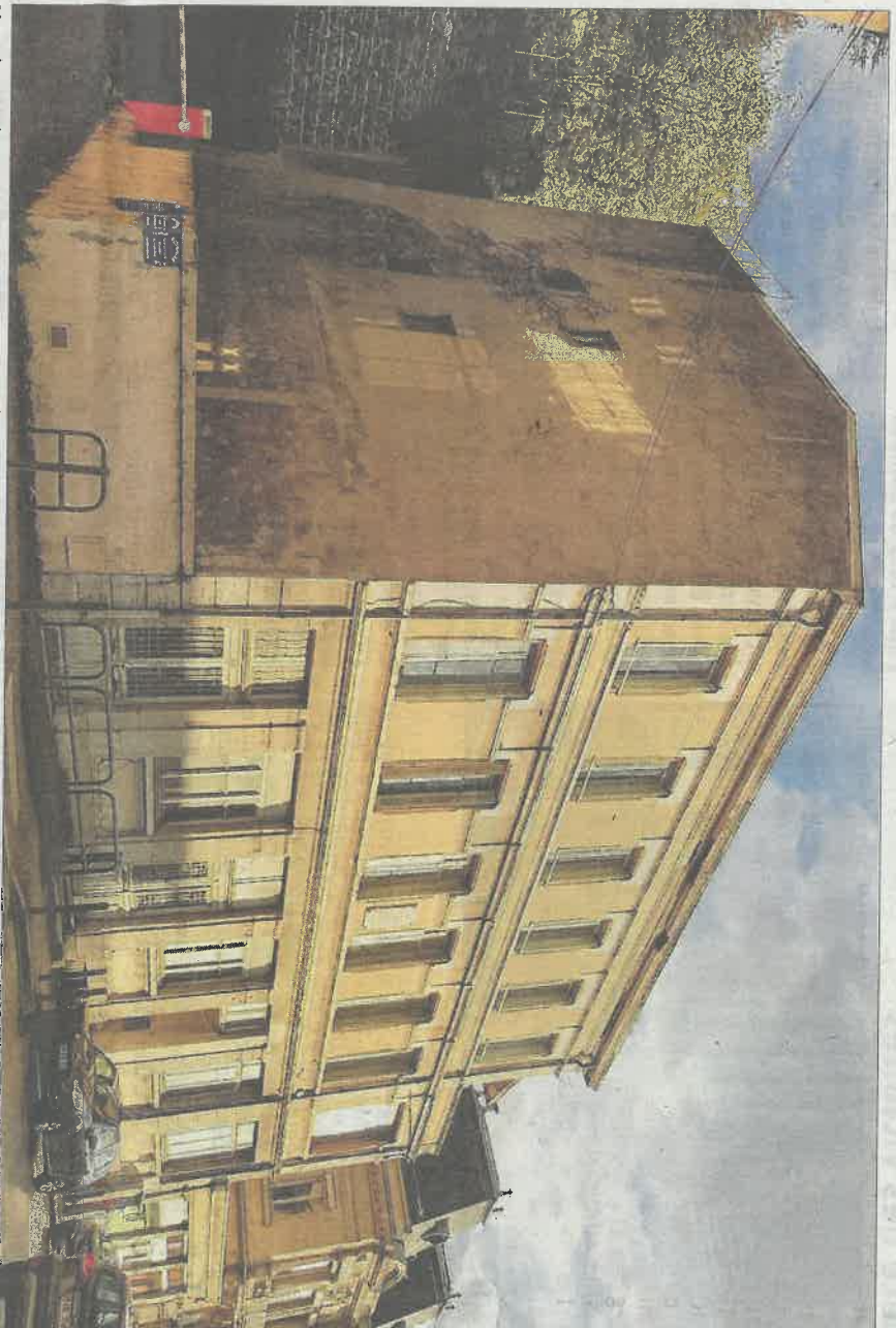
L'ancienne école de musique de Vienne est située au 67, rue Victor-Hugo.

Alors, que pourrait accueillir cet immeuble idéalement placé dans le centre-ville de Vienne ? En raison des règles d'urbanisme applicables au secteur, ce bâtiment ne peut pas être transformé en logements, ni accueillir d'hébergement d'une manière générale. « Concrètement, il peut être utilisé pour du commerce, pour un établissement médico-social, ce genre de choses », estime le centre