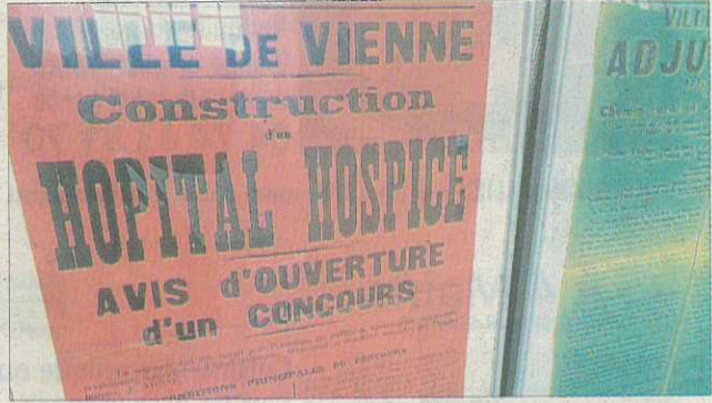
L'exposition présente de nombreux documents inédits qui retracent l'histoire de l'hôpital viennois à l'occasion de ses 80 ans.

en grande pompe par le président de la République Albert Lebrun. Nous sommes allés jusqu'aux 20 ans de l'hôpital. » Avec un focus également sur la Seconde Guerre mondiale. À l'époque, l'hôpital de Vienne avait été réquisitionné par les Allemands.