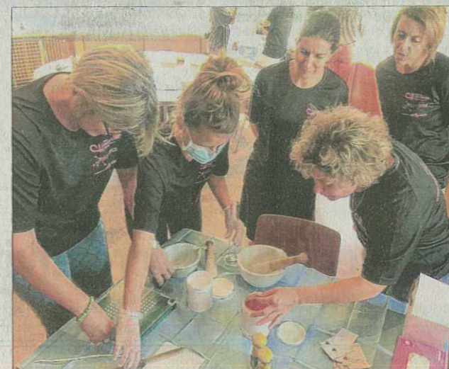
Un atelier était organisé pour apprendre à faire des gélules.

De nouvelles acquisitions exceptionnelles au fonds patrimonial de la médiathèque