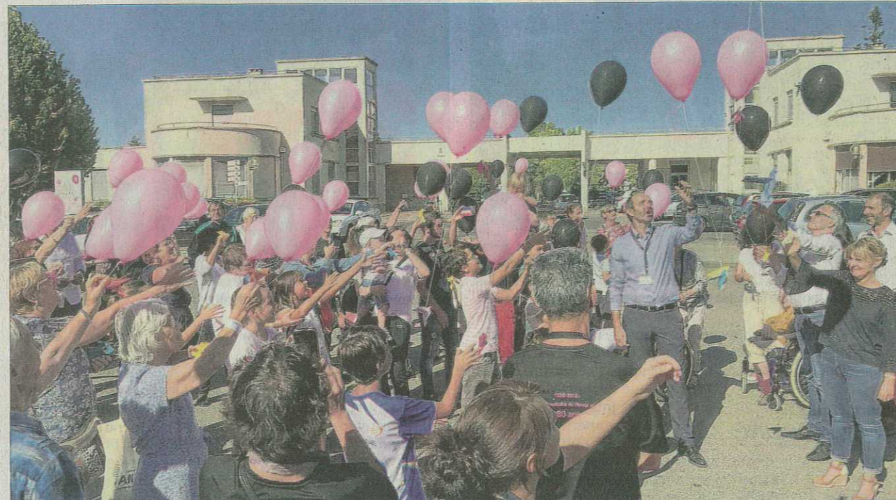
Un lâcher de ballons a eu lieu devant l'hôpital en présence de nombreux salariés.

Des ballons roses et noirs et un magnifique gâteau d'anniversaire. L'hôpital Lucien-Hussel fête hier ses 80 ans en présence des salariés et du public invité pour l'occasion. Une centaine de professionnels était ainsi mobilisée avec des stands pour tout comprendre sur le fonctionnement d'un hôpital. Devant l'établissement, des véhicules de secours étaient également exposés.