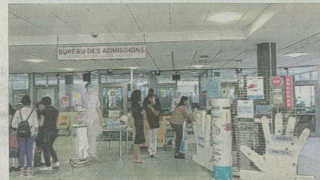
Chaque service tenait un stand autour des thématiques de l'hôpital.