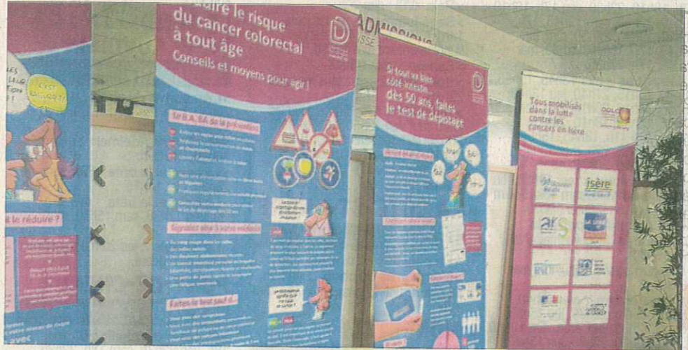
80 % de la population de 50 à 74 ans est concernée par la réalisation de ce test.

Le cancer colorectal touche les hommes et les femmes avec 43 000 nouveaux